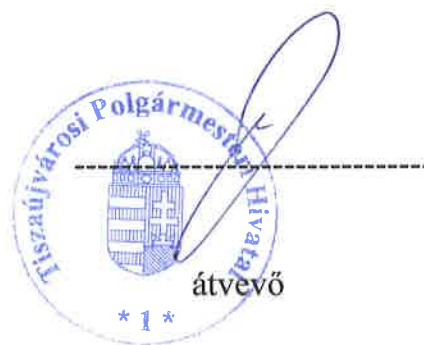
alpolgármester önkormányzati képviselő