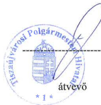
alpolgármester önkormányzati képviselő